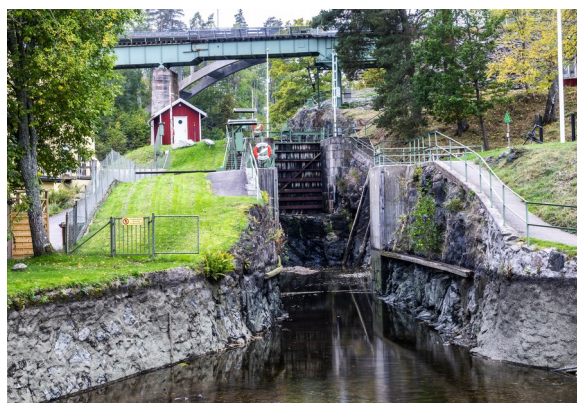
Akvedukten i Håverud

Tjugo minuter från Bengtsfors. Dels imponerande forsar, dels gulligt landskap längs Dalslands kanal.