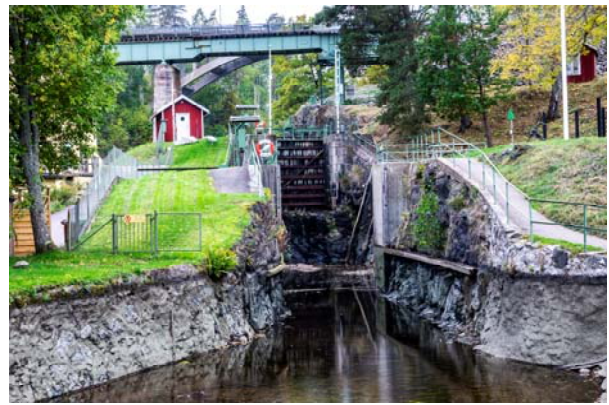
Akvedukten i Håverud

Tjugo minuter från Bengtsfors. Dels imponerande forsar, dels gulligt landskap längs Dalslands kanal.